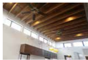
▲ハイサイドライトで明るいLDK M様邸

会場周辺に案内看板あります 道に迷われた場合は TEL:076-213-5505