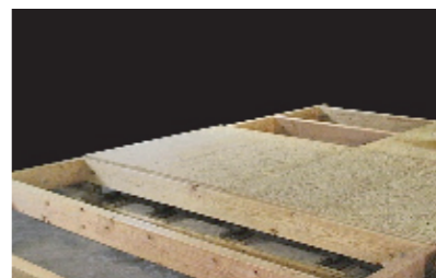
剛床構造 従来の在来軸組構造では、床は根太と呼ばれる材木の上に床を貼る方法であったが、床の下に構造用合板を貼ることで横揺れに対して面で耐力を持たせ、耐震性を向上させた。