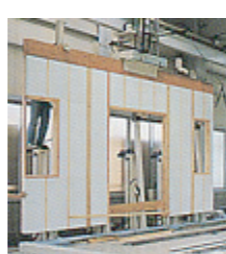
今回、採用したプレウォール工法 通常の在来軸組工法は筋交とよばれる斜めの材で耐力を持たせているが、プレウォール工法は構造用合板（水色の断熱材の裏側）を組み込むことで耐力を確保。断熱材も隙間なくはめ込むことで断熱性も向上している。