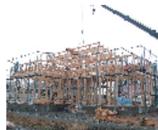
在来軸組工法 柱と梁の軸組みで構成されている。上棟時にほぼ1~2日で屋根まで形作るため、床の濡れは軽減でき、雨の多い北陸に向いている。

と、まあ、構造という点、内容的にはとんでもない話なので、読んでいてちよつと肩が凝ってしまったかもしれない。しかし、長きに亘って大切な家を支え守ってくれる部分です。これを機に、自分の中の「安心」に対するものをしをだして、こだわり所を考えてみるのはいかがでしょうか。