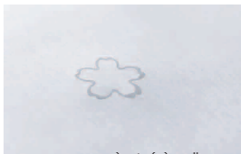
H 2 O, CO 2 , E, E, O 2 水滴が桜の形になります

今、ものづくりは非常に注目されており、例えば、 ステーションナリー一つとっても、高い専門性が要求 されています。設計は人間工学(人間の身体的特性 や精神的機能を研究し、それに適合した使いやす い機械を設計したり、活動しやすい環境をつくら するための学問：参項：国語辞典)やユニバーサル デザインを基本とし、誰もが使いやすい形を基本と しながらも、デザイン性や流行も重要視されるなど、 多岐にわたることもあり、特化した専門学校が多く できているほどです。生活雑貨に求められる質もデ ザイン性も益々高くなり、世の中には種々さまざま なものも溢れています。だからこそ、自分にとって、 価値のあるモノを見極めたいものです。