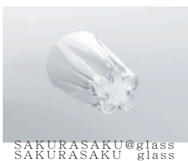
SAKURASAKU@glass SAKURASAKU glass

新しい生活に、新しい生活雑貨を取り入れることで、 気分を「切り替える」。雑貨一つで新しい気持ちになれ る。そんな面白い物って素敵ですね。この季節に一つ、 自分に合った雑貨を探してみたいかがですか？